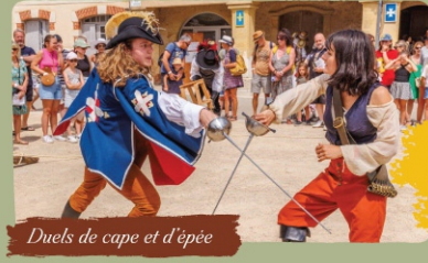
Duels de cape et d'épée