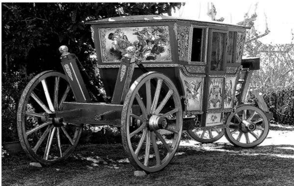
Le carrosse d'apparat de d'Artagnan en cours de construction... (gravure la Gazette)

Tous pour un, un pour tous. La rédaction.