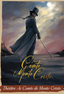
Théâtre : le Comte de Monte-Cristo