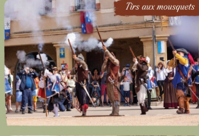
Tirs aux mousquets