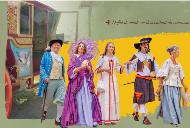
✦ Défilé de mode en descendant du carrosse

500 personnes costumées vous accueillent un jour de foire au XVII e s.