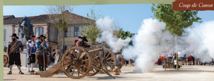
Coup de Canon