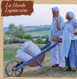
La Horde Lupiacoise