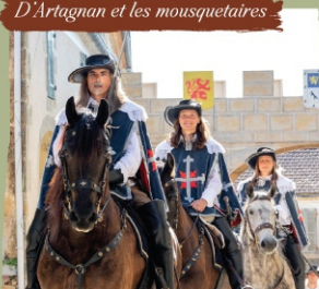
D'Artagnan et les mousquetaires