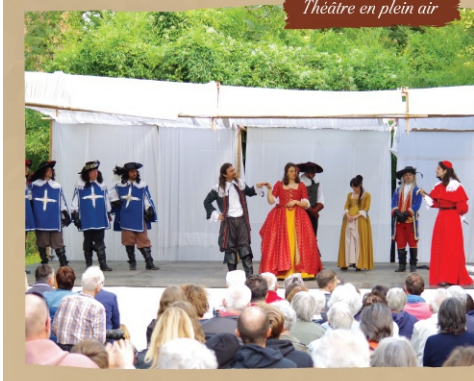
Théâtre en plein air