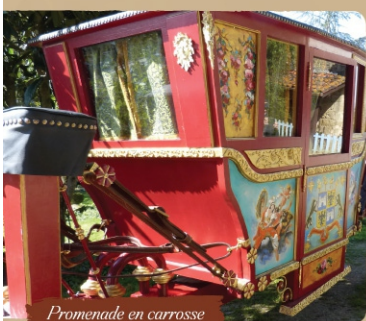
Promenade en carrosse